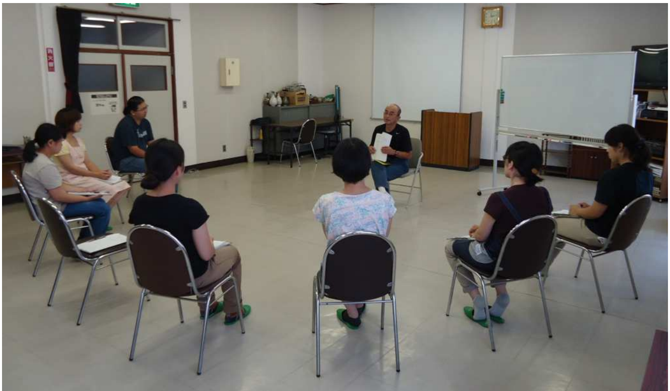
講師と自由に論じ合います。

答えのないテーマについて自由に論じあうことで、ものづくりの心構えを考えるきっかけとしてもらおうという試みです。